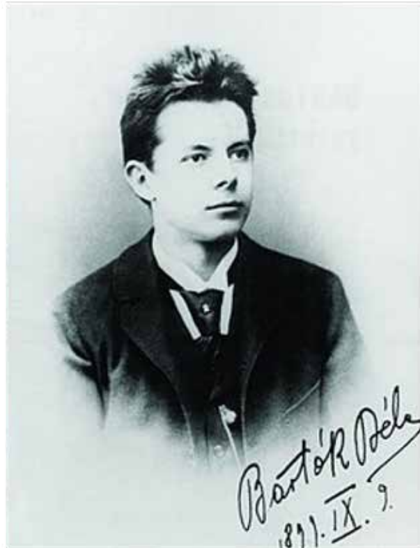
Béla Bartók als 18-Jähriger (1899)