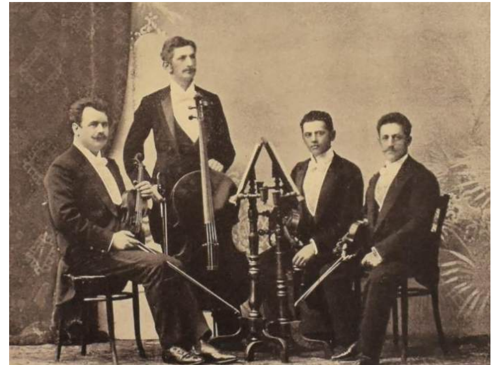
Das Prill-Quartett (um 1900)